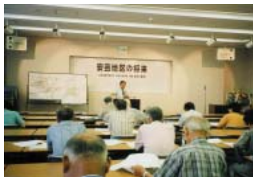
熱が入るセンター長の講演

他に、中野・瀬野を中心とした安芸区の公民館、および安芸郡の各教育委員会からの講師依頼や共同事業等に協力し、現代社会学部の公開市民講座も後援している。