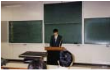
体験談に熱が入る

みなさん何と云っても気になるのは試験でしょう。種類・区分・時期・難易度など、試験情報の収集をしつかりしてください。私の場合は独学でしたが、通信教育を受けました。また、公務員試験情報誌や過去問題集にもぜひ目を通しました。教養試験は範囲が広いうえに奥が深いので、的を絞った学習のほうが逆に効果的かもしれません。専門試験(論文)については、機械・電子の技術屋さんの卵として日頃から見解や問題意識をもっていれば対応できるでしょう。国家試験の場合にはさらに二次試験(面接)が控えています。私は面接試験に関する本から質問内容を想定して対策を練りました。試験前後に行う官庁訪問では、人事担当の方と実質的な話をしながら充分自己アピールしてください。