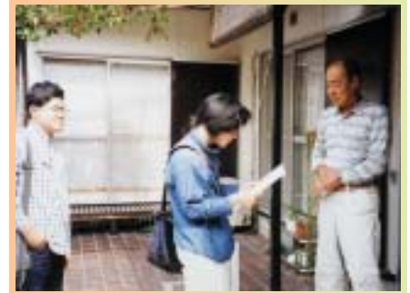
家庭を訪問する学生

これからコンピュータを使ってデータを加工・分析し、冊子にまとめる。地域の方々にも是非読んでいただきたいと思う。「顔の見える大学」として一步を踏み出した現代社会学部が、地域に根ざし愛される存在となるよう努力していきたいと願っている。