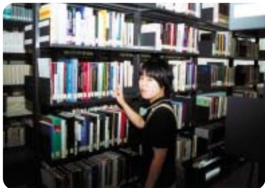
宣伝や広告に興味を持っている