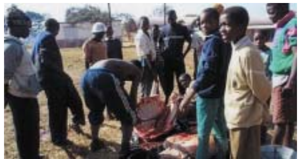
学校は調理場に早変わり

う~ん、ザンビアの牛肉は美味しい! さすがに1年8カ月も生活していると、こういう場面にも慣れてしまいました。いまでは、たまに鶏を買って来て自分で料理します。もちろん生きていますよ。私もたくましくなったもんだ。(2001年8月8日)