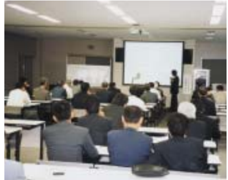
技術講演会 = 会場

本学は、地域の発展に寄与する方法を模索している。ひとつの試みとして、技術交流会を実施した。地元企業の代表や小・中・高等学校の理数系教員にお集まりいただき、本学教員と交流した。技術講演会、施設公開のほか、懇談をかねた昼食会を行った。参加者は合計37名で、評価も上々だった。来年はより多くの参加を得られるよう準備を急ぎ、広く案内したい。