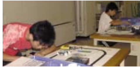
ロボットは動く?楽しかった!面白かった!

情報機器のマルチメディア化に対処できる高度技術者を育成することを目的に、「音声情報処理」、「音響情報処理」、「画像処理工学特論」、メディア伝送に関する「ネットワーク特論」、数値シミュレーションを教える「シミュレーション工学特論」。